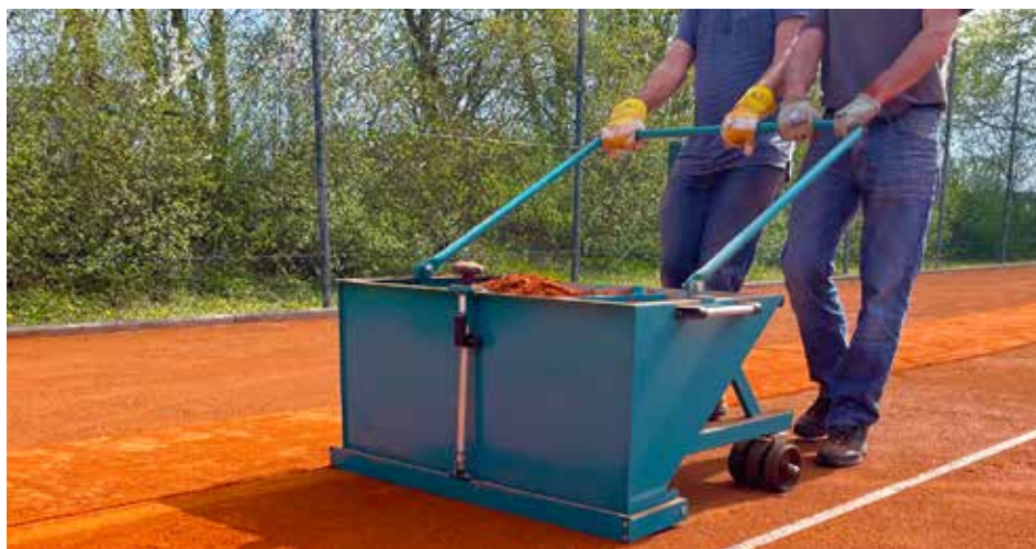
Neuer Sand für die Saison 2024.