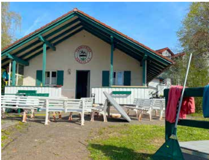
Frühjahrsputz auf der Tennisanlage.

Samstag, 11. Mai, 9 Uhr: TSV Schondorf – TC Pürgen