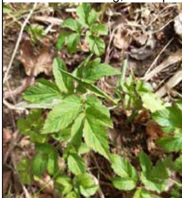
Giersch am 20.03.

Aber Vorsicht: beim Pflücken sollten Sie drauf achten, dass Sie ihn nicht mit dem Schierling verwechseln! Die Stängel des Giersch sind 3-eckig, man spürt deutlich die Kanten.