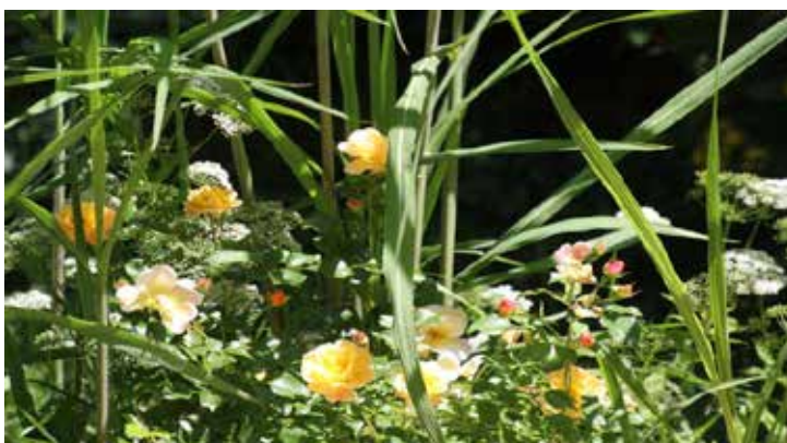
Gierschblüten (weiß) zwischen Rose und Bambus

Vielleicht sollte man sich auch mal generell darüber Gedanken machen, warum man als Gartler so wild drauf ist, Unkräuter zu definieren und dann zu eliminieren. Das Zitat unten finde ich sehr aufschlussreich und hat meinen Blick auf Kräuter und Unkräuter deutlich verändert!