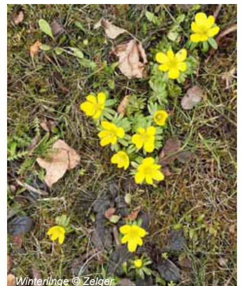
Winterlinge © Zelger