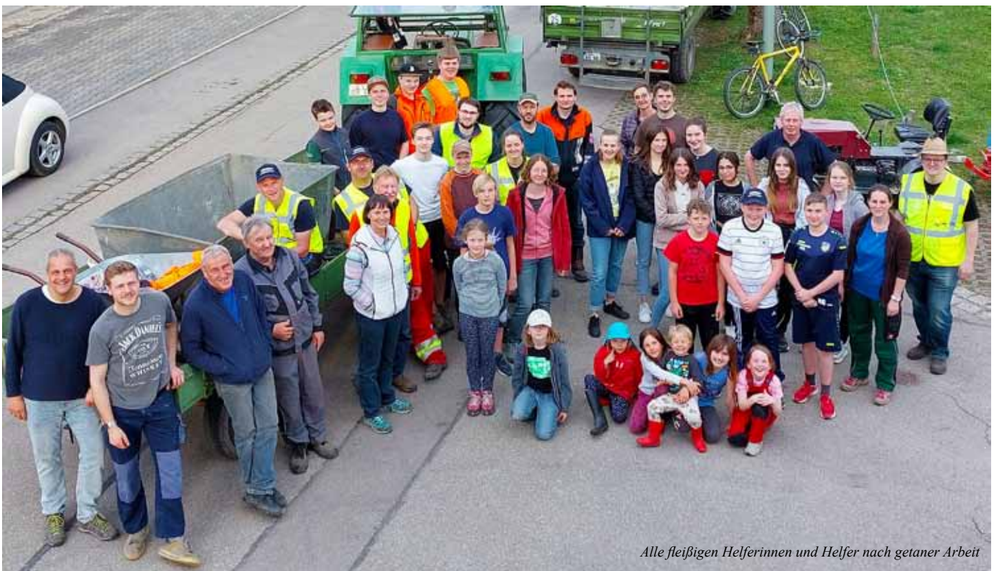
Alle fleißigen Helferinnen und Helfer nach getaner Arbeit