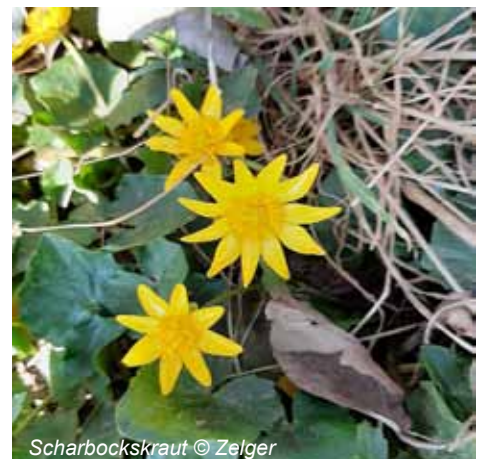
Scharbockskraut © Zelger