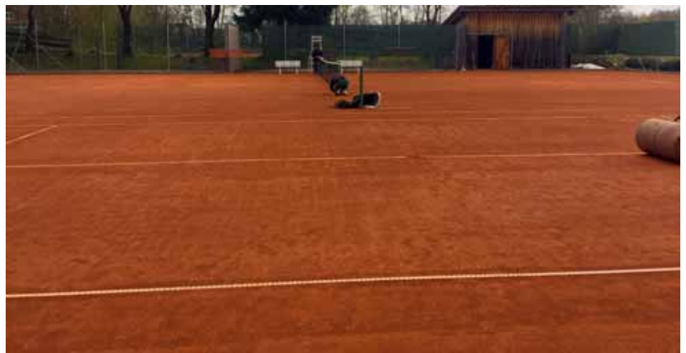
Die letzten Vorbereitungen sind getroffen, die Saison kann starten. Seit Mitte April sind die Plätze des TC Pürgen wieder bespielbar.