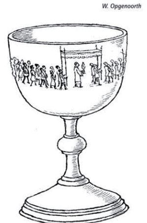
Die Fronleichnamsprozession ermutigt uns, im Alltag in den Prozess der Liebe Jesu einzutreten.