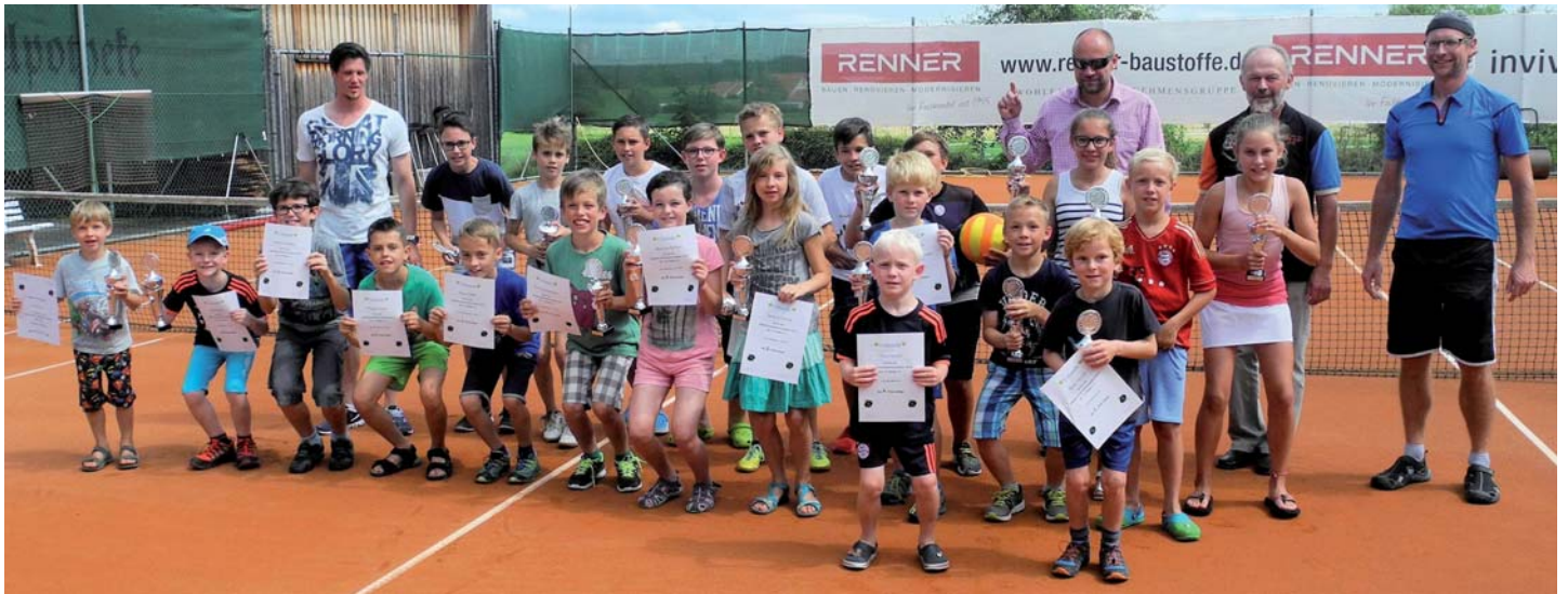
Alle Teilnehmer der Jugendvereinsmeisterschaften des TC Pürgen auf einen Blick.