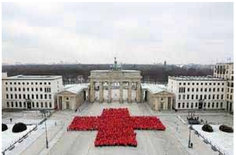
1.800 ehrenamtliche und hauptamtliche Mitarbeiter des Deutschen roten Kreuzes versammeln sich in Berlin am 13.01.2013 anlässlich des Jubiläums „150 Jahre Deutsches Rotes Kreuz

Ohne Sie läuft nichts - die Fördermitglieder des Roten Kreuzes.