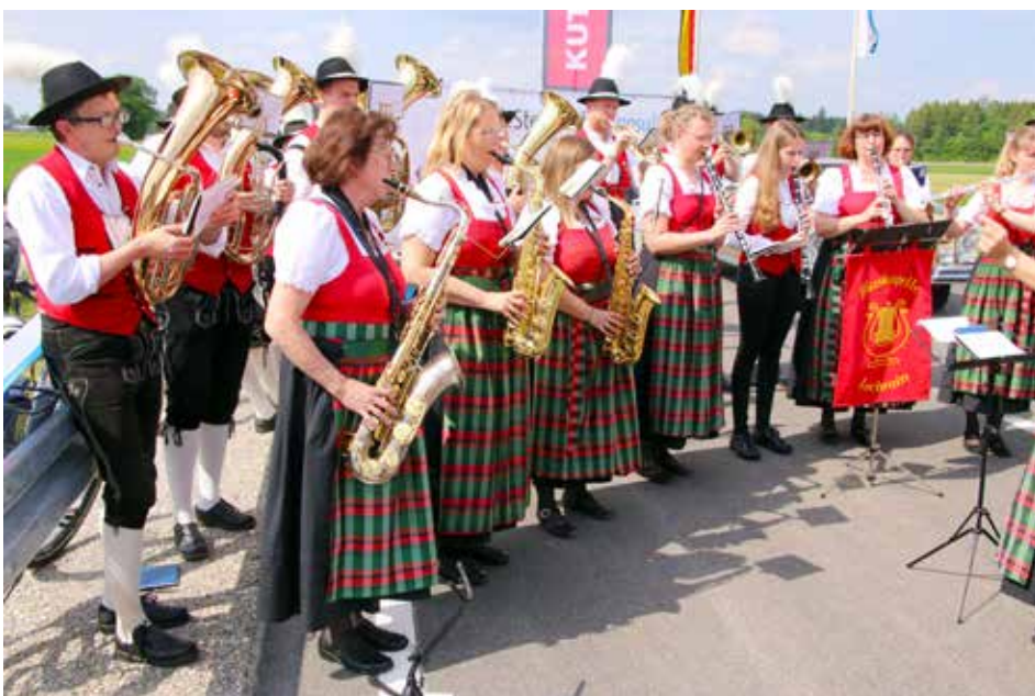
Die Blaskapelle Lechain umrahmt musikalisch die Feierstunde und unterhält anschließend die Gäste im Bierzelt