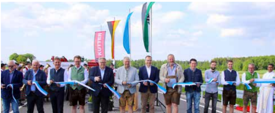
Das Band ist durchschnitten – damit wird die Straße sinnbildlich für den Verkehr freigegeben. Mit dabei die Ehrengäste aus Politik, dem Planungsbüro und den ausführenden Firmen.