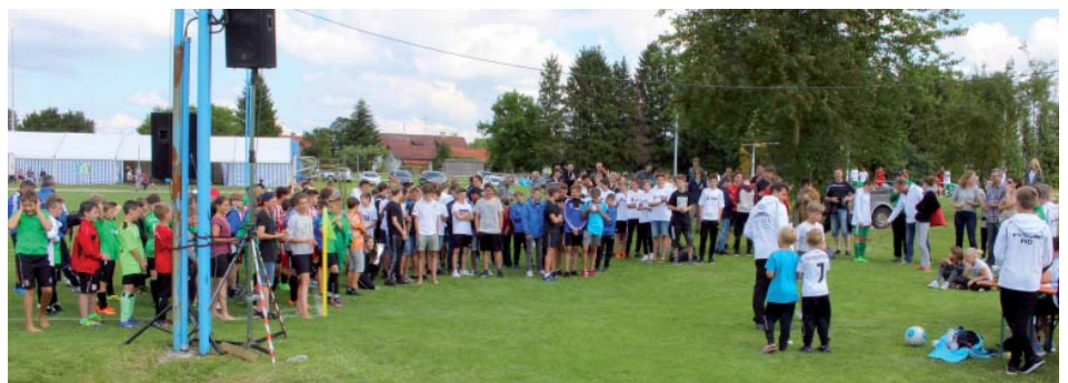
Siegerehrung U13 / U15