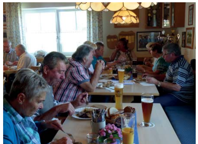
Eine nette Runde hatte sich eingefunden