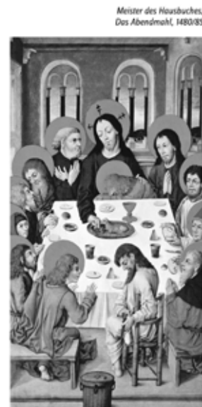
Uns kostet die Messe eine Stunde. Ihm hat sie das Leben gekostet.